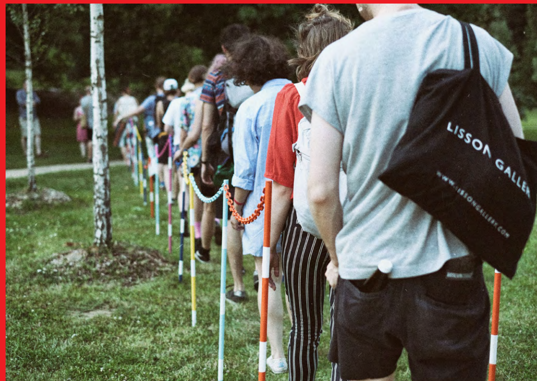
instalace Skrót (Zkratka) polské umělkyně Karoliny Balcer (2018)