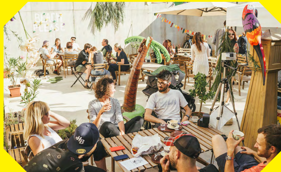
festivalové centrum na Jizbě

Pojí nás silná osobní vazba k Luhačovicím a zlínskému regionu, odkud většina z nás pochází.