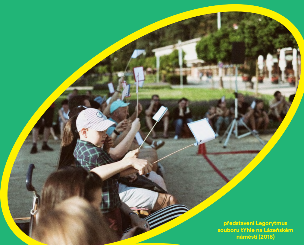
představení Legorytmus souboru tYhle na Lázeňském náměstí (2018)